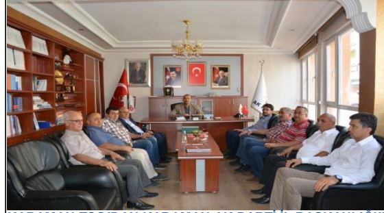
KARAMAN TSO'DAN KARAMAN AK PARTİ İL BAŞKANLIĞI'NA HAYIRLI OLSUN ZİYARETİ

Ziyaret birlikte hatıra fotoğrafının çekilmesinin ardından sona erdi.