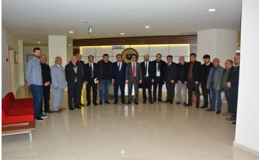
MHP HEYETİ'NDEN KTSO'YA ZİYARET

Karaman Milliyetçi Hareket Partisi Teşkilatı, Karaman Ticaret ve Sanayi Odası Başkanlığı'nı ziyaret etti.