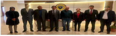
ODAMIZDA TSE BELGE YENİLEME TETKİKİ BAŞARIYLA TAMAMLANDI

Odamızda hizmet kalitesini artırmak ve sürekliliğini sağlamak üzere uygulanan Türk Standartları Enstitüsü Belgelendirme Merkezi (TSE) tarafından TSE EN ISO 9001:2015 versiyonu belge yenileme tetkiki başarıyla tamamlandı.