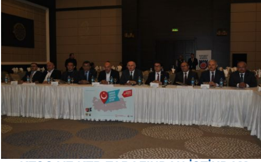
KTSO VE KTB TARAFINDAN İSTİHDAM SEFERBERLİĞİ 2019 VE YENİ İSTİHDAM TEŞVİKLERİ TOPLANTISI YAPILDI

Karaman Ticaret ve Sanayi Odası ile Karaman Ticaret Borsası tarafından “İstihdam Seferberliği 2019 ve Yeni İstihdam Teşvikleri konulu toplantı düzenlendi.