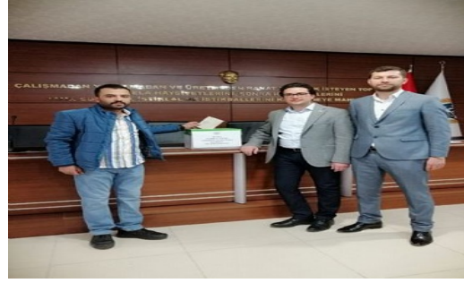
TOBB KADIN VE GENÇ GİRİŞİMCİLER KURULU İCRA KOMİTESİ SEÇİMLERİ YAPILDI

Türkiye Odalar ve Borsalar Birliği (TOBB) Koordinasyonunda, oda ve borsalarda, TOBB İl Kadın Girişimciler Kurulu ve TOBB İl Genç Girişimciler Kurulu İcra Komitesi Üyeliği seçimleri yapıldı.