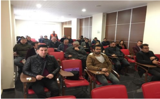
KTSO'DA “SORUMLU EMLAK DANIŞMANI MYK SINAVI” YAPILDI

Karaman Ticaret ve Sanayi Odası ve TOBB MEYBEM A.Ş. işbirliğinde “Mesleki Yeterlilik Belgelendirme Sınavları” kapsamında “Sorumlu Emlak Danışmanı Seviye 5 Sınavı” düzenlendi.