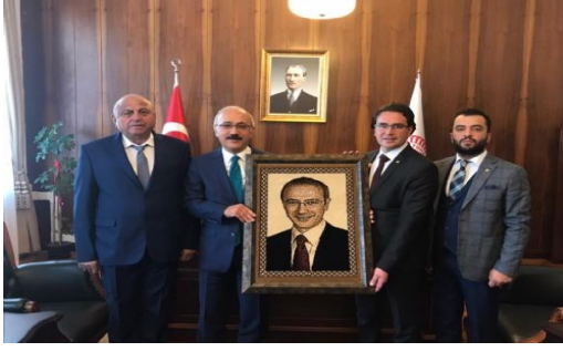
KTSO BAŞKANLARINDAN PLAN VE BÜTÇE KOMİSYONU BAŞKANI LÜTFİ ELVAN'A ZİYARET

Plan ve Bütçe Komisyonu Başkanı Lütfi Elvan, Karaman Ticaret ve Sanayi Odası Başkanlarını makamında kabul etti.