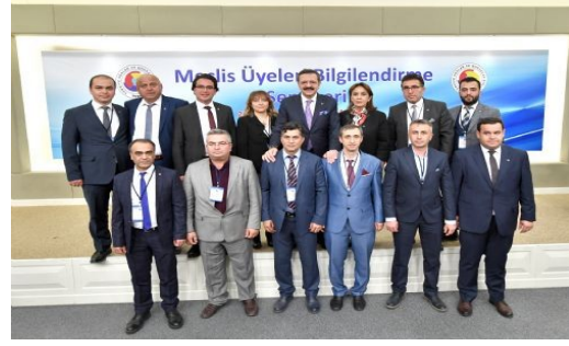
KTSO MECLİS ÜYELERİ, "TOBB MECLİS ÜYELERİ BİLGİLENDİRME SEMİNERİNE" KATILDI