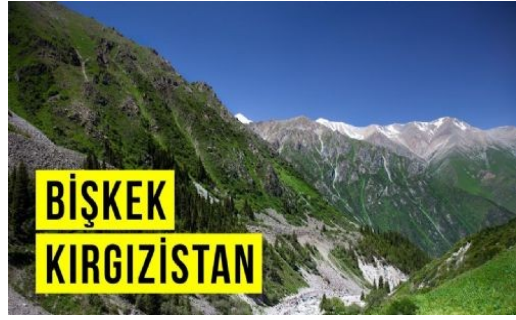
KIRGIZİSTAN İŞ VE İNCELEME GEZİSİ DAVETİ