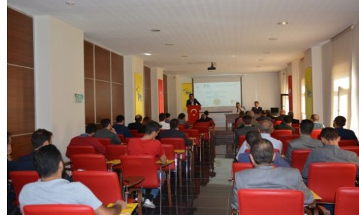
KTSO'DA PttTRADE TANITIM TOPLANTISI DÜZENLENDİ

Karaman Ticaret ve Sanayi Odası ile PTT Karaman Başmüdürlüğü işbirliğinde "PttTRade Tanıtım Toplantısı" yapıldı.