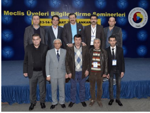
KARAMAN TSO MECLİS ÜYELERİ TOBB 18. MECLİS ÜYELERİ BİLGİLENDİRME SEMİNERİNE KATILDI

13-14-15 Mart günlerini kapsayan 18. Meclis Üyeleri Bilgilendirme Semineri Karaman Ticaret ve Sanayi Odası Meclis Üyelerinin yoğun katılımıyla TOBB Sosyal Tesislerinde gerçekleşti.