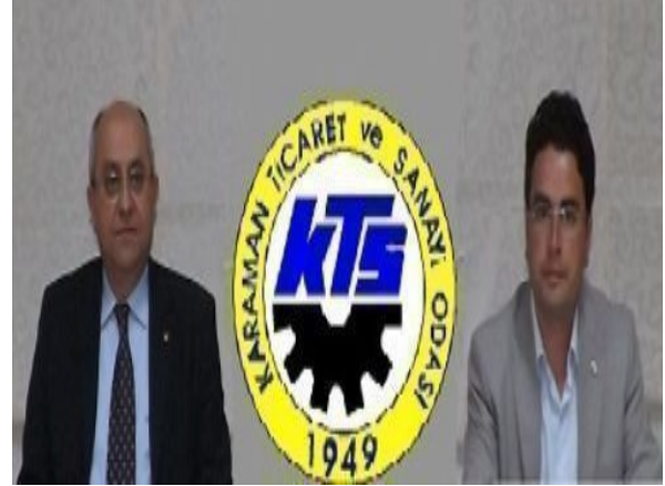
KTSO'DAN 18 MART ÇANAKKALE ZAFERİ VE ŞEHİTLERİ ANMA GÜNÜ MESAJI