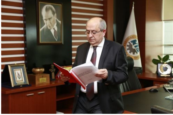
KTSO BAŞKANI MUSTAFA TOKTAY HATIRLATTI; "E- TEBLİGAT SÜRESİ UZATILDI"

Ülkemiz genelinde 1 Ocak 2016 tarihinden itibaren yürürlüğe girecek olan elektronik tebligat yani e-tebligat uygulaması için başvurular 1 Nisan 2016 tarihine kadar uzatılmıştır.