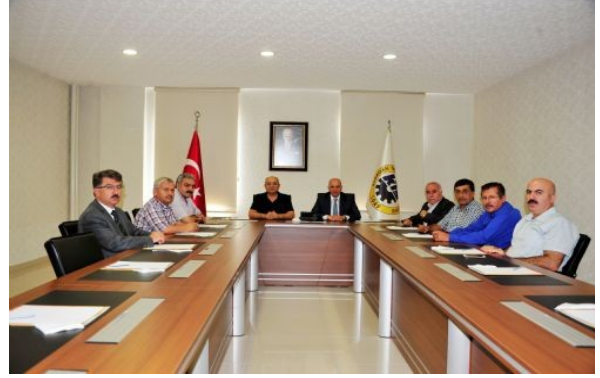
TERÖRE KARŞI ORTAK TAVIR "Asil Milletimizi, Sükunet İçerisinde Birliğe Davet Ediyoruz"

Karaman Belediyesi , Ticaret Odası, Ziraat Odası, Ticaret Borsası, Esnaf ve Sanatkarlar Odaları Birliği ,Muhtarlar Derneği teröre karşı ortak tavır toplantısı gerçekleştirdiler."Terörü ve bu kanlı süreçten medet umanları bir kez daha kınıyoruz" dediler.