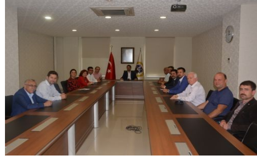
CHP HEYETİ'NDEN KARAMAN TİCARET VE SANAYİ ODASI'NA ZİYARET

Karaman Cumhuriyet Halk Partisi seçim çalışmaları dolayısıyla Karaman Ticaret ve Sanayi Odası Başkanlığı'nı ziyaret etti.