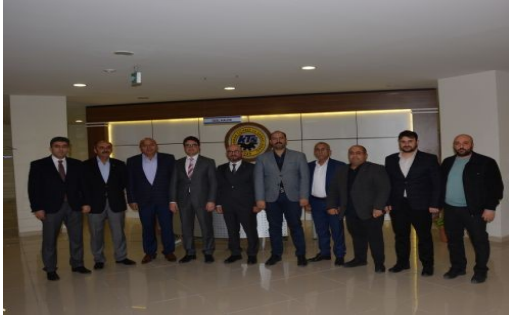
AK PARTİ TEŞKİLATI'NDAN KTSO'YA ZİYARET

Karaman Ak Parti Teşkilatı, Karaman Ticaret ve Sanayi Odası Başkanlığı'nı ziyaret etti.