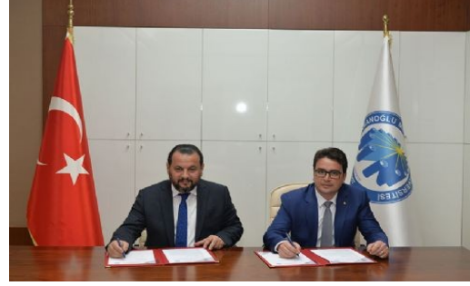
KMÜ İLE KTSO ARASINDA İŞBİRLİĞİ PROTOKOLÜ İMZALANDI