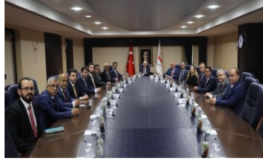
KARAMAN TİCARET VE SANAYİ ODASI YÖNETİCİLERİNDEN KALKINMA BAKANİ SAYIN LÜTFİ ELVAN'A ZİYARET