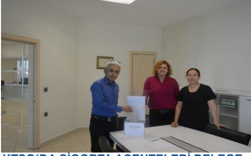
KTSO'DA SİGORTA AÇENTELERİ DELEGE SEÇİMLERİ YAPILDI

Sigorta Acenteleri İl Delegeliği seçimleri 5 Temmuz 2018 Perşembe günü saat 09:30 da başlayıp 16:30 da sona erdi.