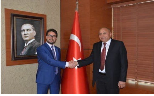
KARAMAN TİCARET VE SANAYİ ODASI'NDAN KURBAN BAYRAMI KUTLAMA MESAJI