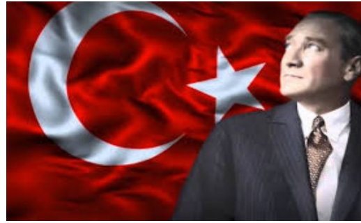
KTSO BAŞKANLARIN'DAN 30 AĞUSTOS ZAFER BAYRAMI KUTLAMA MESAJI