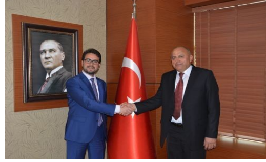
KTSO BAŞKANLARINDAN 19 MAYIS ATATÜRK'Ü ANMA GENÇLİK VE SPOR BAYRAMI KUTLAMA MESAJI