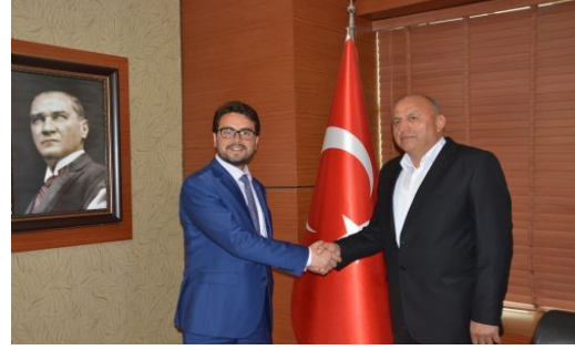
KARAMAN TİCARET VE SANAYİ ODASI'NDAN RAMAZAN BAYRAMI KUTLAMA MESAJI